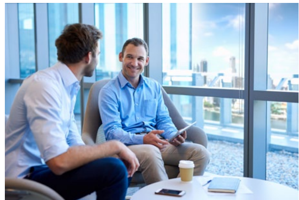
Mit HAVERKAMP Dynamic: transparent in allen anderen Lichtsituationen