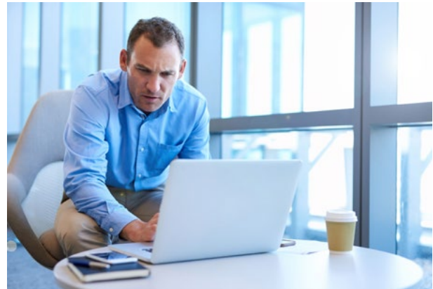
Ohne HAVERKAMP Dynamic: extreme Blendung bei direkter Sonneneinstrahlung