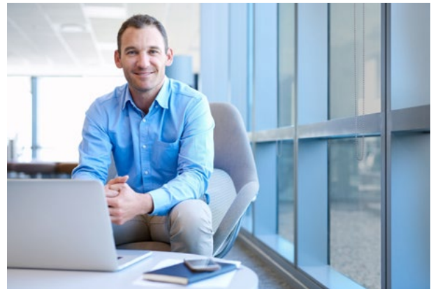
Mit HAVERKAMP Dynamic: dynamischer Hitze-, Sonnen- und Blendschutz (Folie getönt)